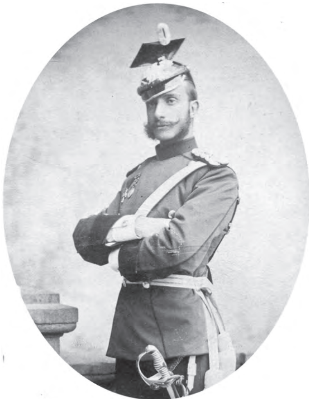
Alphonse XII, 1857-1885, Roi d'Espagne