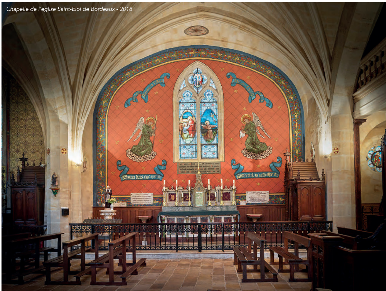
Chapelle de l'église Saint-Eloi de Bordeaux - 2018