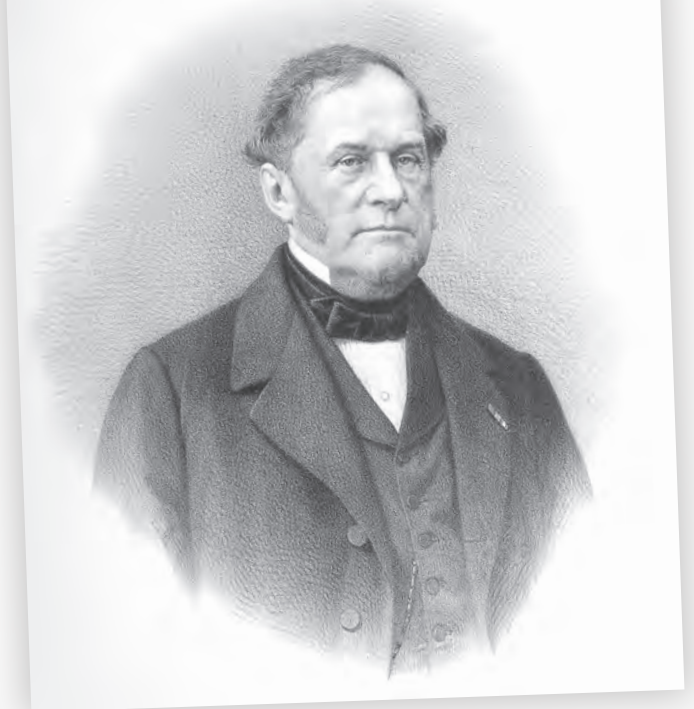
Charles-Marie Tanneguy, Comte Duchâtel 1803-1867

En 1865, Charles-Marie Tanneguy, Comte Duchâtel, ancien Ministre de l'Intérieur (1839-1848), également ancien ministre des Finances (1836-1837) et du Commerce (1834), déjà propriétaire du prestigieux cru médocain Château Lagrange, s'investit pleinement dans la mise en valeur de la propriété en modernisant les installations techniques des chais et en rénovant le Château dans un style hispano-byzantin.